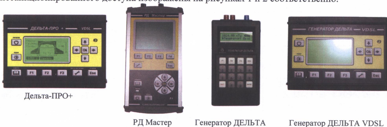
Рисунок 1 - Общий вид моделей измерителя

Общий вид моделей ДЕЛЬТА-ПРО+ и схема пломбирования от несанкционированного доступа изображены на рисунках 1 и 2 соответственно.