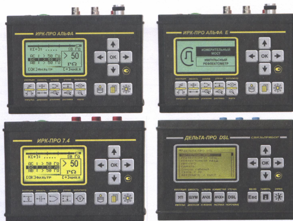
Рисунок 1 - Общий вид моделей прибора