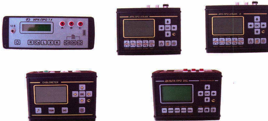
Рисунок 1 Общий вид моделей прибора