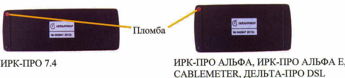
Рисунок 2 Вид прибора сзади